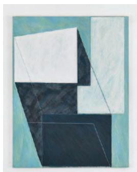
Salner_Bild3.jpg Arthur Salner, 2015 Tempera/Leinen, 180 x 135