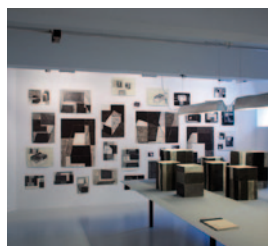
AS_6.jpg Blick in die Ausstellung „Arthur Salner: Raumbilderwelten“