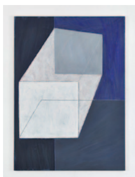
Salner_Bild2.jpg Arthur Salner, 2015 Tempera/Leinen, 180 x 135