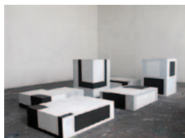
Salner_Atelier.jpg Atelier von Arthur Salner mit dreidimensionalen Bildobjekten Bildnachweis: © Arthur Salner