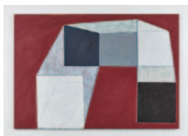
Salner_Bild1.jpg Arthur Salner, 2015 Tempera/Leinen, 180 x 260