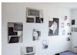
Salner_Atelier2.jpg Atelier von Arthur Salner

Weiteres frei verwendbares Bildmaterial steht Ihnen nach Aufbau der Ausstellung voraussichtlich ab 27. September 2016 auf unserer Web-Site zur Verfügung.