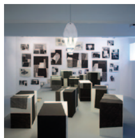
AS_7.jpg Blick in die Ausstellung „Arthur Salner: Raumbilderwelten“