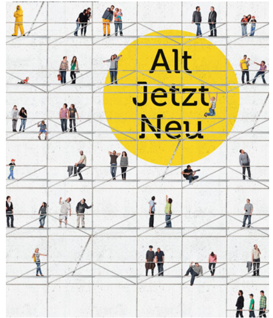
1 Plakatsujet

Und weil das „Jetzt“ nicht zu kurz kommen darf, feiern wir zum Abschluss im Rapoldipark eine „Hausgeburt“.