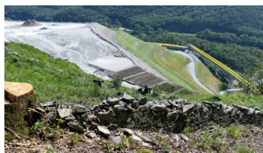
1, 2 Sigirino Depot