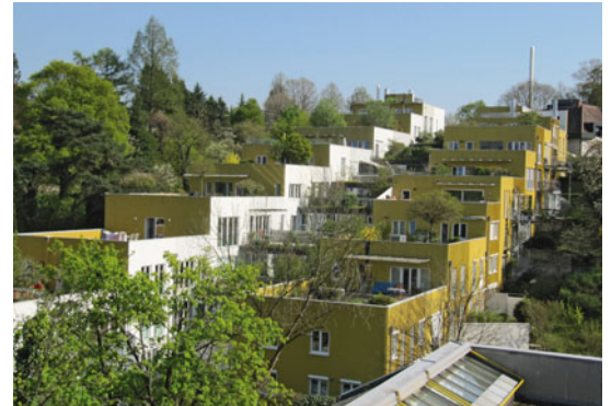
1 Wohnpark Art Erlaa, Wien 2 Guglmugl, Linz