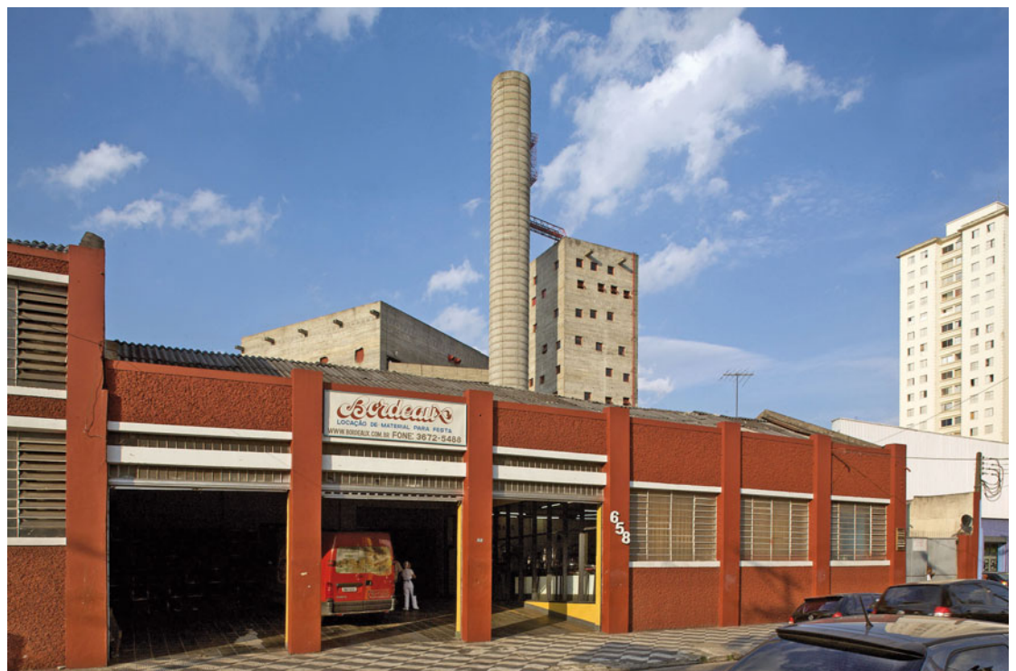
1 Günter Richard Wett, SESC-Pompéia von Lina Bo Bardi, São Paulo, 2008

Und irgendwann neigt sich der Tag dem Ende zu, und nun gilt es, der Architektur die letzten Geheimnisse zu entlocken, diesen magischen Moment der blauen Stunde nutzend, der leider niemals eine Stunde währt. Wenn die sich in den Fenstern spiegelnde Umgebung schön langsam dem Einblick ins Innere weicht und das letzte Tageslicht der bereits untergegangenen Sonne das Außen noch sichtbar lässt, dann ist wieder Zeit, den Auslöser zu drücken – so wie ich jetzt die letzte Taste drücke!!! (3.200 Zeichen)