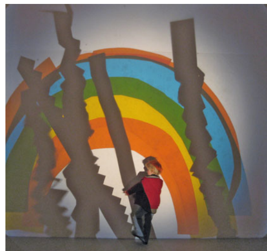
1 Foto aut