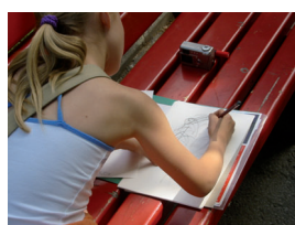
04_stadtparcours.jpg Symbolbild Kinderprogramm