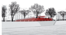
02_visu_columbosnext.jpg „Ich will an den Inn“ Visualisierung: © columbosnext