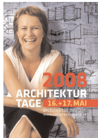
sujet.jpg Hauptsujet „Architekturtage 2008“

Die Bilder können Sie in einer Auflösung von 72 dpi bzw. 300 dpi (Bildbreite ca. 10 cm) von unserer Web-Site „www.aut.cc“ im Pressebereich downloaden und im Rahmen der Berichterstattung über die Architekturtage 2008 und unter Anführung der jeweiligen Bildnachweise kostenlos verwenden.