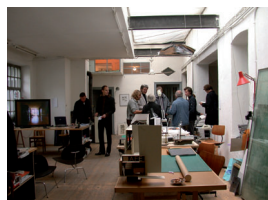
13_offeneAteliers.jpg Symbolbild (Architekturtage 2002)