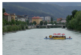
05_floss.jpg „Innsbruck vom Inn“