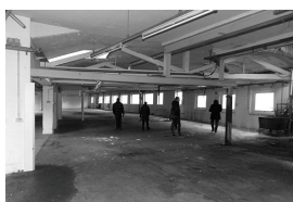
5_Hopfgarten_Ritsch_Dummer.jpg Lederfabrik Ritsch, Hopfgarten