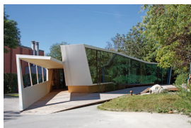
1_bildung_Wett.jpg bildung, Innsbruck

Die Bilder können Sie in einer Auflösung von 72 dpi bzw. 300 dpi (Bildbreite ca. 15 cm) von unserer Web-Site „www.aut.cc“ im Pressebereich downloaden und im Rahmen der Berichterstattung über die Architekturtag 2016 und unter Anführung der jeweiligen Bildnachweise kostenlos verwenden.