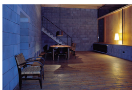
4_Koeberl_DOWASwett.jpg Übergangshaus des DOWAS, Innsbruck Architektur: Rainer Köberl