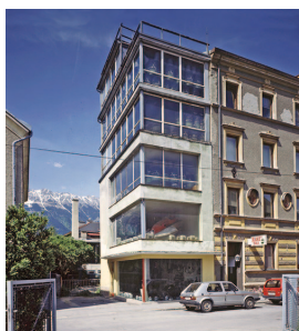
7_Mathe_Schletterer.jpg Otto-Mathé-Haus, Innsbruck