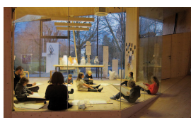
2_bildung_2.jpg bildung, Innsbruck