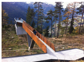
6_fliess_gachenblick_columbosnext.jpg Aussichtsplattform Gachenblick, Fliess Architektur: columbosnext