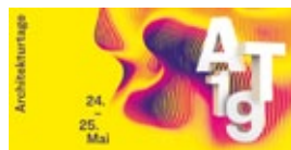
AT19_Sujet_quer.jpg Sujet der Architekturtag 2019