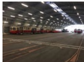
1_Remise©IVB.jpg Neue Remise der IVB, Innsbruck